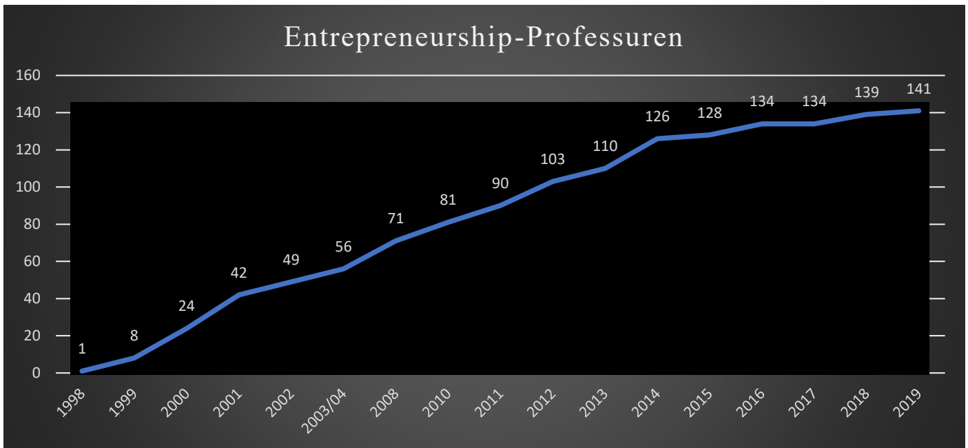
Abbildung 1: Entwicklung der Anzahl der/besetzten Entrepreneurship-Professuren in Deutschland für den Zeitraum 1998–2004 und 2008–2019 (März 2019)